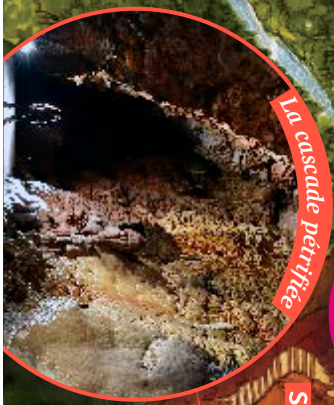
La cascade pétrifiée