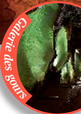
Galerie des smogs

«Allez donc voir Dargilan même si vous connaissez les plus jolies cavernes d'Europe» a écrit le fondateur de la spéléologie française E. A. Martel.