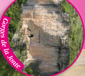
Gorges de la Jone